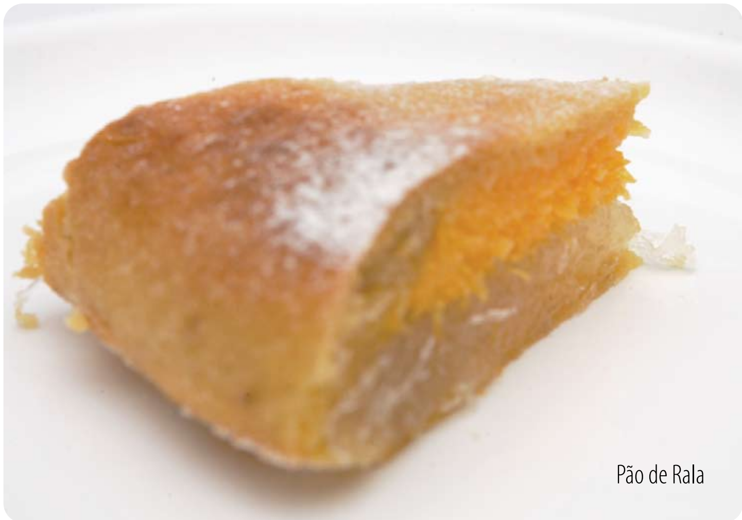
Pão de Rala