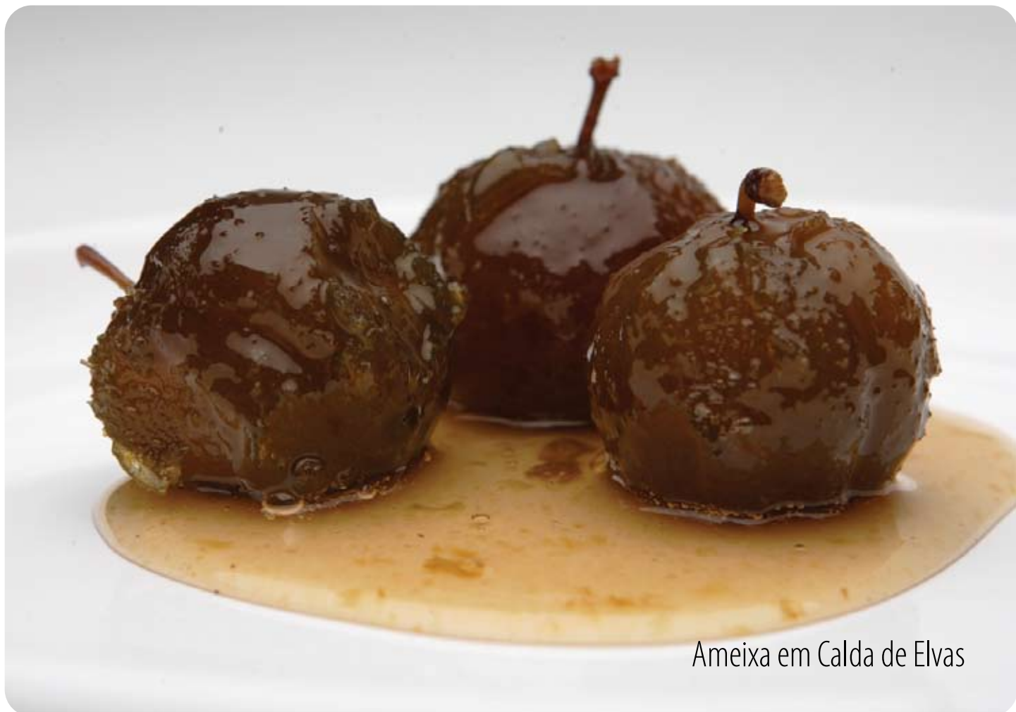
Ameixa em Calda de Elvas